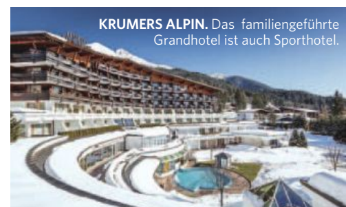
KRUMERS ALPIN. Das familiengeführte Grandhotel ist auch Sporthotel.